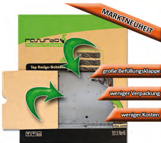
Innovativ & praktisch: Retailbox mit gestanzter Klappe für versandfreundliche Zusatzbestückung!